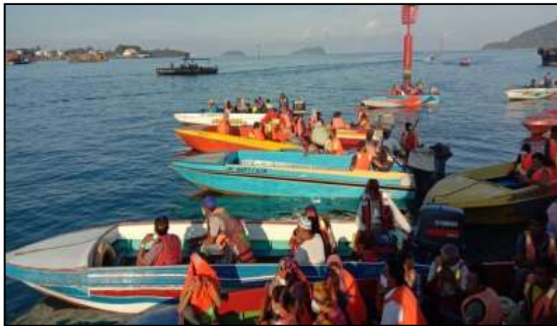
Foto 1 : Penggunaan Bot Penambang oleh Penduduk Pulau Gaya ke Bandaraya Kota Kinabalu, Sabah